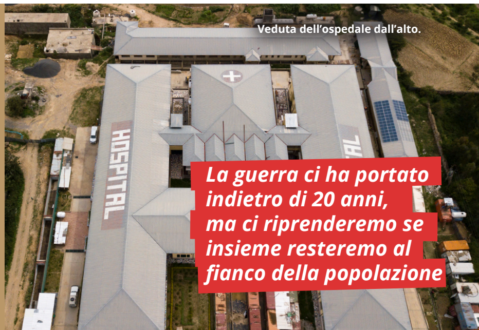
Veduta dell'ospedale dall'alto.

L'ospedale di Adwa, grazie ai suoi sostenitori, non si è mai fermato e continuerà ad esserci per portare cure d'eccellenza, speranza e futuro a chi ne ha più bisogno.